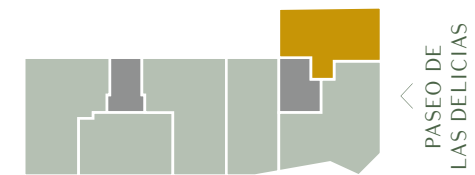
C/ PALOS DE LA FRONTERA